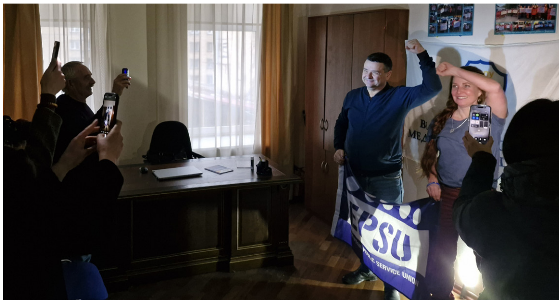
Möte under ett besök 2024 hos KVPU och dess anslutna fackföreningar. Det är mörkt eftersom strömmen har gått, vilket ofta händer i Kyiv, men mötet fortsatte ändå.

I diskussionen om Ukrainas framtid hamnar dessa frågor ofta i bakgrunden. Samtidigt visar erfarenheter från Union to Unions långvariga samarbete med den ukrainska fackföreningsrörelsen att arbetsmarknadens parter spelar en avgörande roll. Denna kortrapport bygger vidare på en tidigare studie om facklig organisering i Ukraina 1 . Syftet är att bidra med ett kompletterande perspektiv på landets långsiktiga utveckling, där arbetsmarknadens parter och social dialog 2 ses som en del av återuppbyggnadens genomförande – snarare än som en fråga vid sidan av.