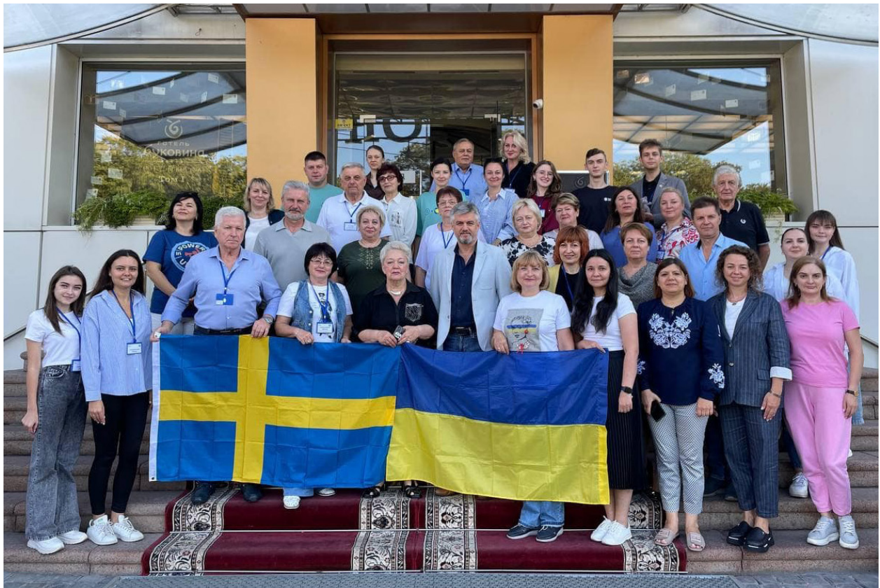
En grupp fackliga representanter vid ett strategiskt möte som anordnats av SEUU (State Employees Union of Ukraine).

Samtidigt innebär återuppbyggnadens omfattning och finansiering att internationella aktörer, däribland EU och bilaterala partners som Sverige, får en avgörande roll. Hur dessa aktörer utformar sitt stöd och vilka krav de ställer kan i hög grad påverka förutsättningarna för social dialog och ett fungerande genomförande av reformer.