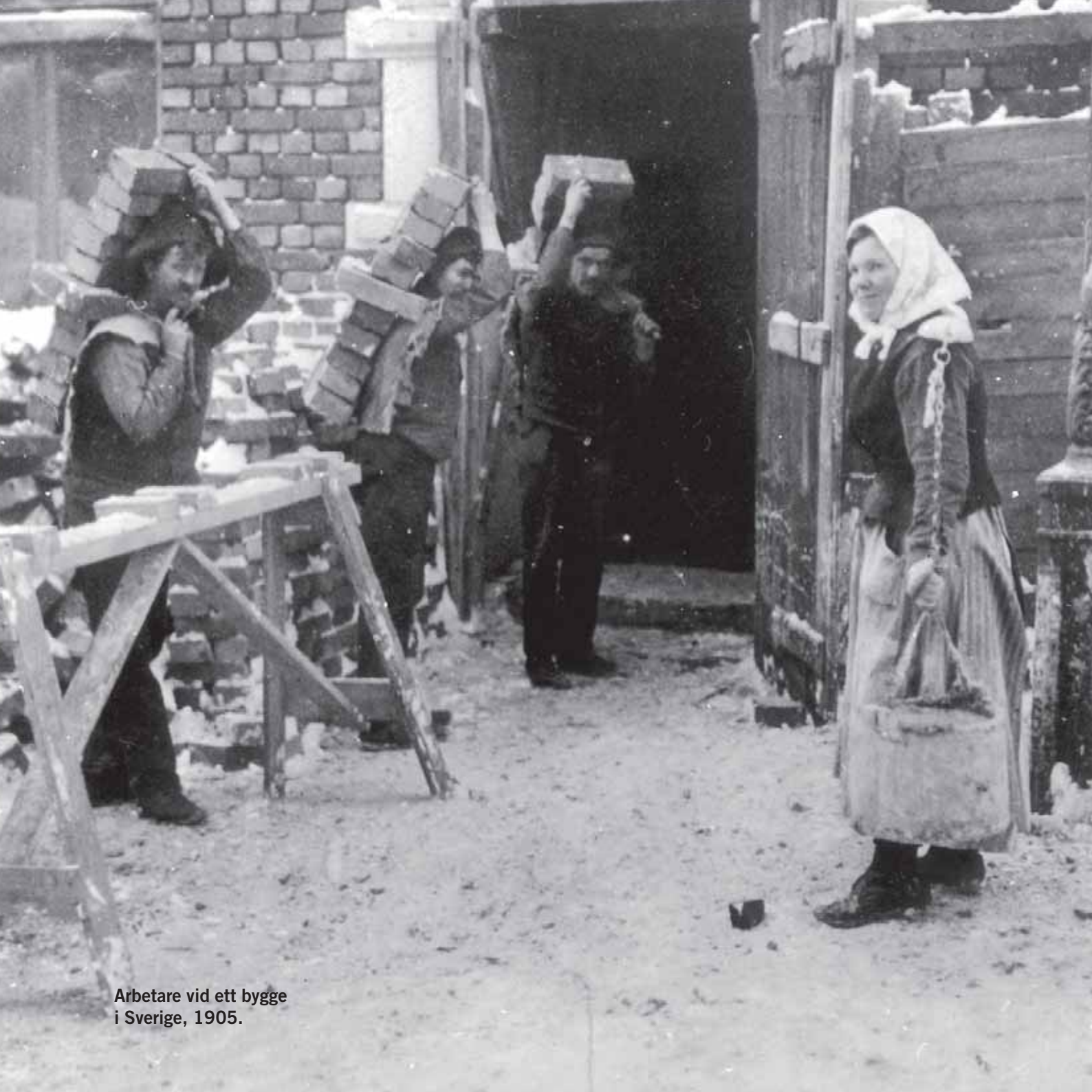
Arbetare vid ett bygge i Sverige, 1905.