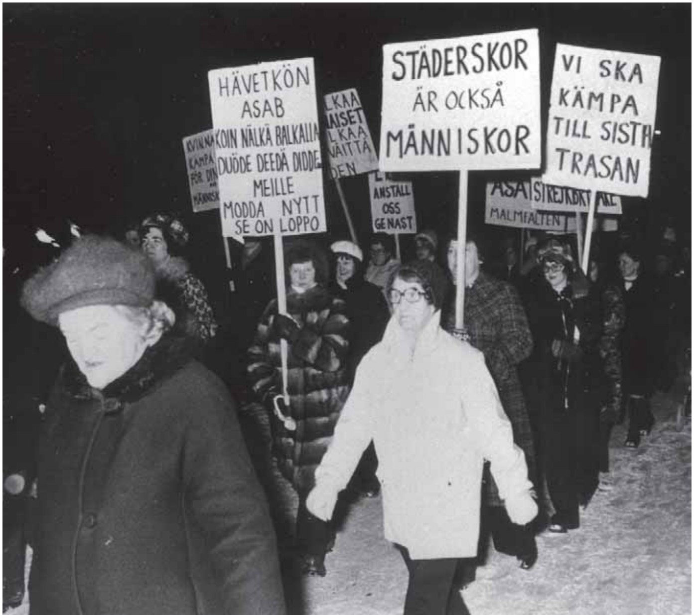
Städstrejken 1974-75 berodde på missnöje med arbetsgivaren, det multinationella bolaget ASAB, som erbjöd ett tungt arbete till låg lön och med dåliga arbetstider. Strejken började i Borlänge och spreds sedan till Malmfälten, Skövde och Umeå. Solidariteten med städerskorna var stor i landet, många samlade in pengar och ordnade stödaktioner.