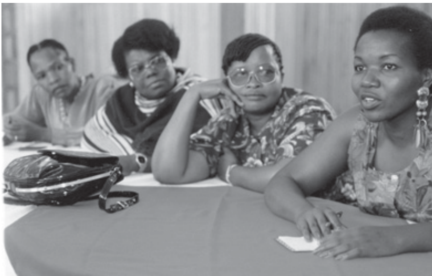
Fackligt möte i Kenya.

internationella verktygslåda som fackliga organisationer i dag kan använda sig av: