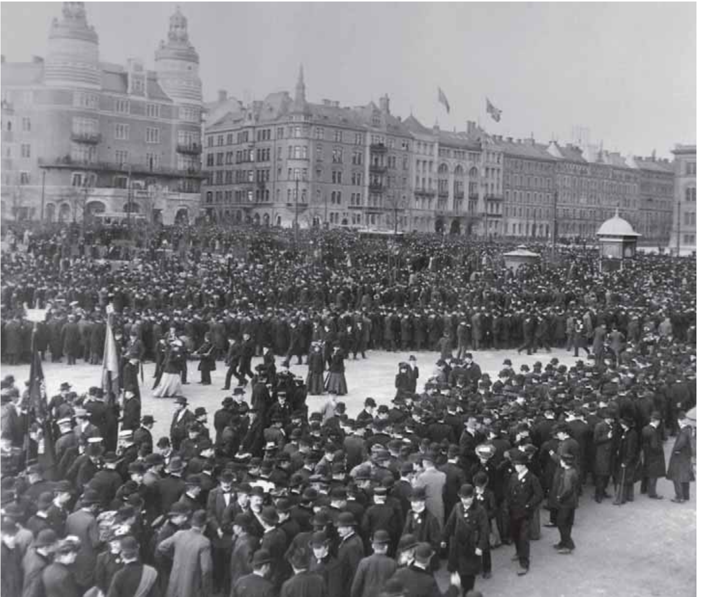
Norra Bantorget i Stockholm under storstrejken 1909. Strejken bröt ut när SAF ville ha lönesänkningar och 80 000 arbetare inom textil-, sågverks- och pappersmasseindustrin blev lockoutade. Det fick LO att svara med en generalstrejk. Endast sjukvård och andra viktiga funktioner undantogs.