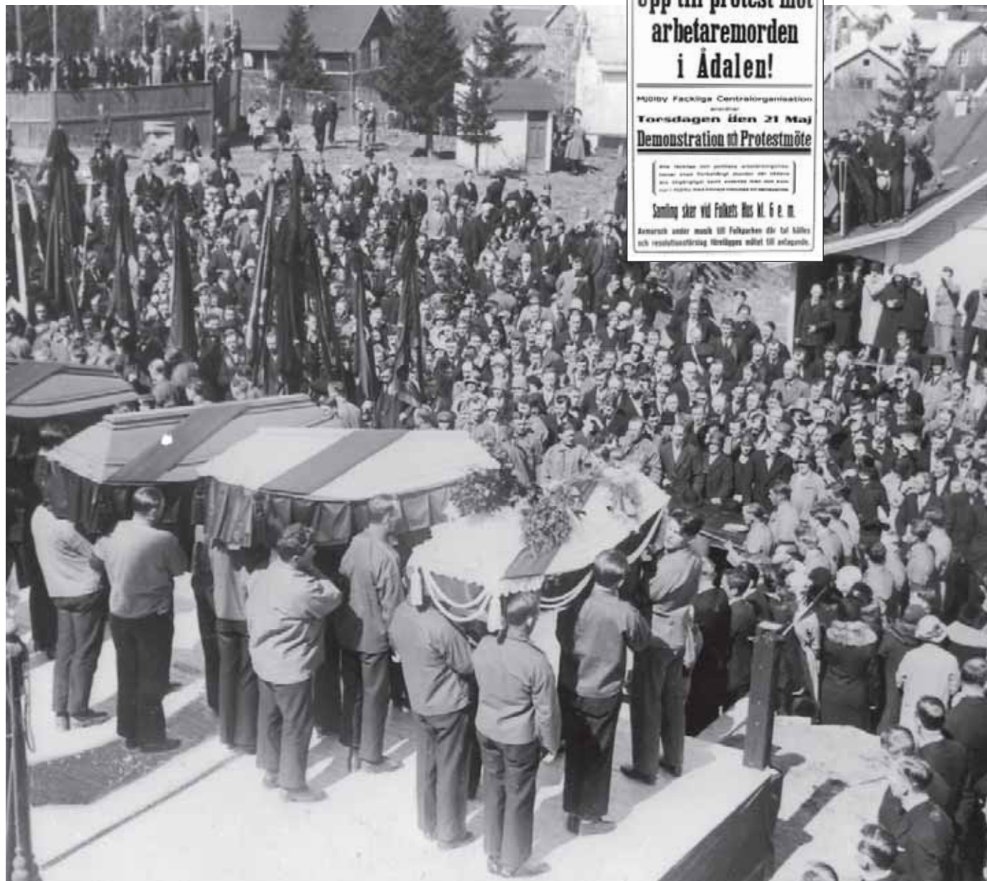
Begravningen av dem som sköts till döds i Ådalen 1931. Händelsen ledde till enorma protester i hela landet.