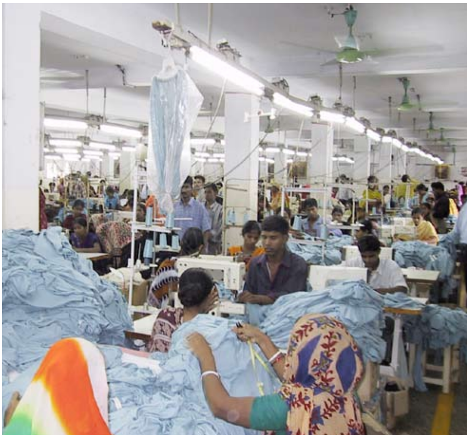
I flera länder i Asien finns så kallade ekonomiska frizoner där facklig organisering är förbjuden eller de fackliga rättigheterna är kraftigt inskränkta.

fackliga rörelsen finns en nybildad facklig centralorganisation, ITUCK. I Kazakstan finns också ett starkt gruvarbetareförbund som har en oberoende status.