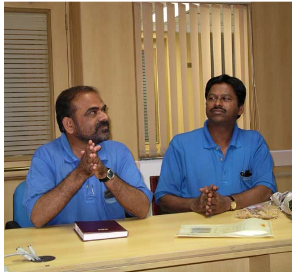
Utan kontakter med ett lands fackliga organisationer är det svårt att förstå vad som sker i arbetslivet. Fackliga företrädare ger ett annat perspektiv än företag och myndigheter.

»För miljontals människor i fattiga länder är facklig verksamhet enda vägen till inflytande över sin egen livssituation.«