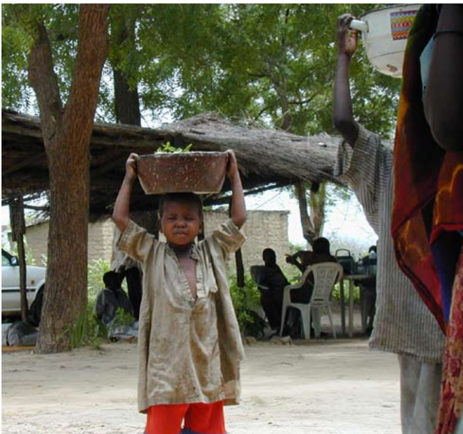
Barnarbete ökar alarmerande i Afrika. De afrikanska fackföreningarnas grundhållning är att få bort den grova exploateringen av barn och att barn ska gå i skolan istället för att arbeta.

historia finns många undantag som bryter mot den övergripande berättelsen. I Nordafrika är de fackliga organisationerna fortfarande knutna till statsapparaterna, även om en viss grad av facklig självständighet kan skönjas i länder som Algeriet och Tunisien. I andra afrikanska länder har de fackliga organisationerna mer eller mindre slagits sönder på grund av krig och inbördeskrig, som i Somalia och Liberia.