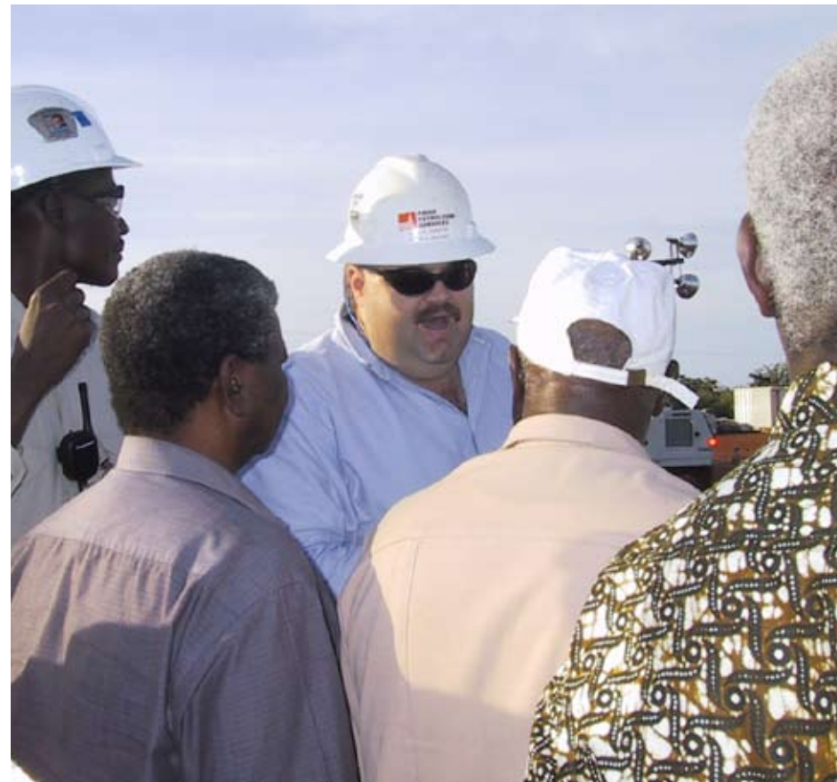
Utan kontakter med ett lands fackliga organisationer är det svårt att förstå vad som sker i arbetslivet. Fackliga företrädare ger ett annat perspektiv än företag och myndigheter.

»För miljontals människor i fattiga länder är facklig verksamhet enda vägen till inflytande över sin egen livssituation.«