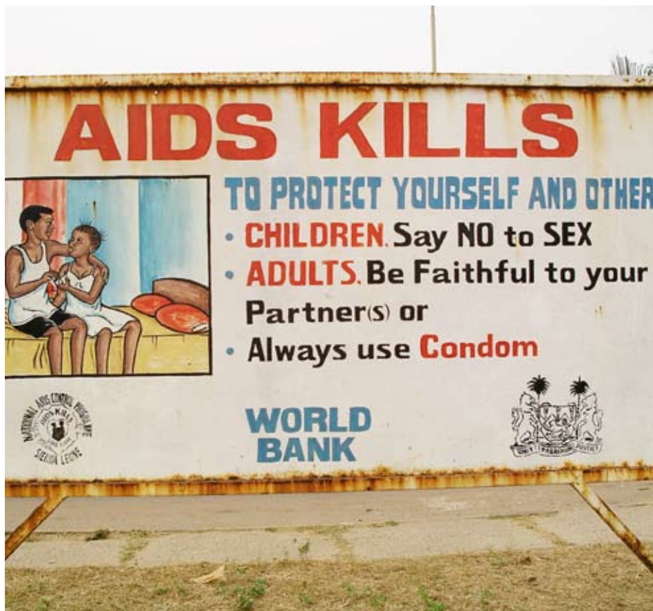
I brist på andra folkrörelser och en svag offentlig sektor har de fackliga organisationerna i flera länder blivit ledande i upplysningsarbetet för att till exempel förhindra spridningen av hiv/aids.