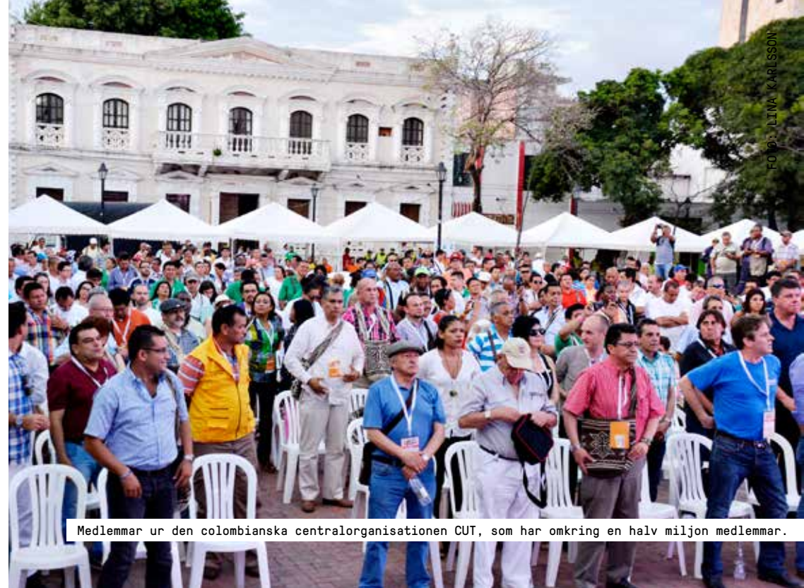
Medlemmar ur den colombianska centralorganisationen CUT, som har omkring en halv miljon medlemmar.

Utän kontakter med ett lands fackliga organisationer är det svårt att förstå vad som sker i arbetslivet. Fackliga företrädare ger ett annat perspektiv än företag och myndigheter. Ett underifrånperspektiv. För att det ska vara möjligt att effektivt bekämpa fattigdomen är det viktigt att dessa röster finns med i debatten. Minskad fattigdom handlar inte bara om ekonomi – framförallt handlar det om att ge människor möjlighet att påverka sina villkor i arbetsliv och samhälle. Om bägge parterna på arbetsmarknaden erkänns – både arbetsgivare och fackliga representanter – så kan kollektivavtal upprättas som bidrar till stabilitet och