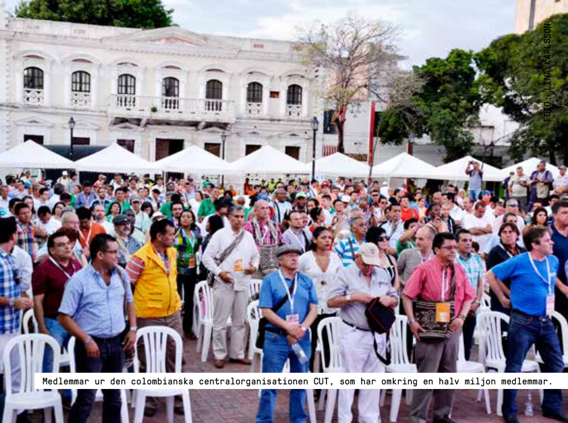
Medlemmar ur den colombianska centralorganisationen CUT, som har omkring en halv miljon medlemmar.